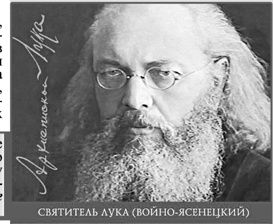
СВЯТИТЕЛЬ ЛУКА (ВОЙНО-ЯСЕНЕЦКИЙ)

Что давало ему такую стойкость, откуда он брал силы? Будущий святитель верил, что Господь не оставит его и не разубеждался в этом. Он писал: “Путь по замерзшему Енисею в сильные морозы был очень тяжел для меня. Однако именно в это трудное время, я очень ясно, почти реально ощущал, что